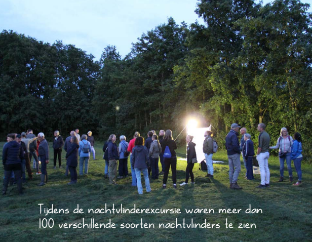
Tijdens de nachtvlinderexcursie waren meer dan 100 verschillende soorten nachtvlinders te zien