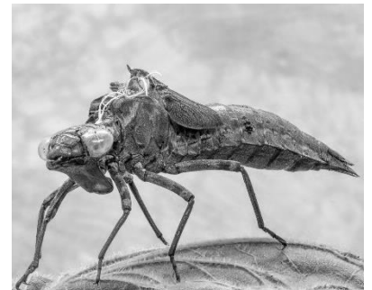
Figuur 2: Larve van libelle

Doe water in de bak. Ga met het net door het water en spoel het net uit in de bak. Zie je diertjes?