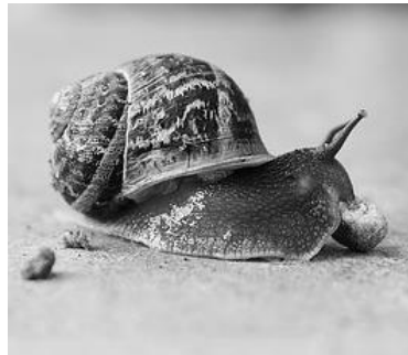
Figuur 1: Poelslak