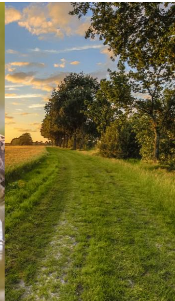
Soorten Kruidenrijk grasland