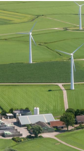
Klimaat CO 2