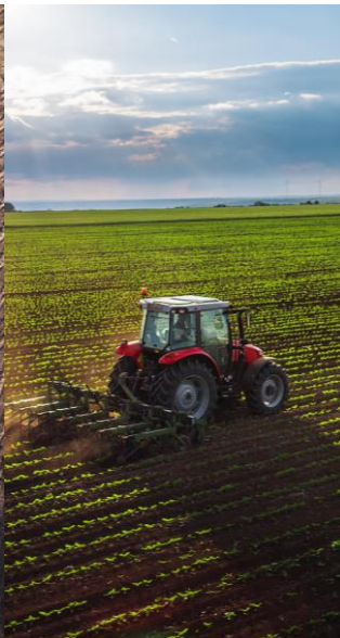
Emissies NH 3