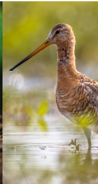
Landschap Aandeel beheer