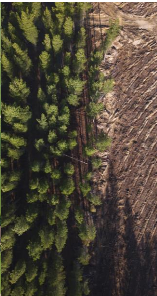
Landgebruik Blijvend grasland Eiwit van eigen land