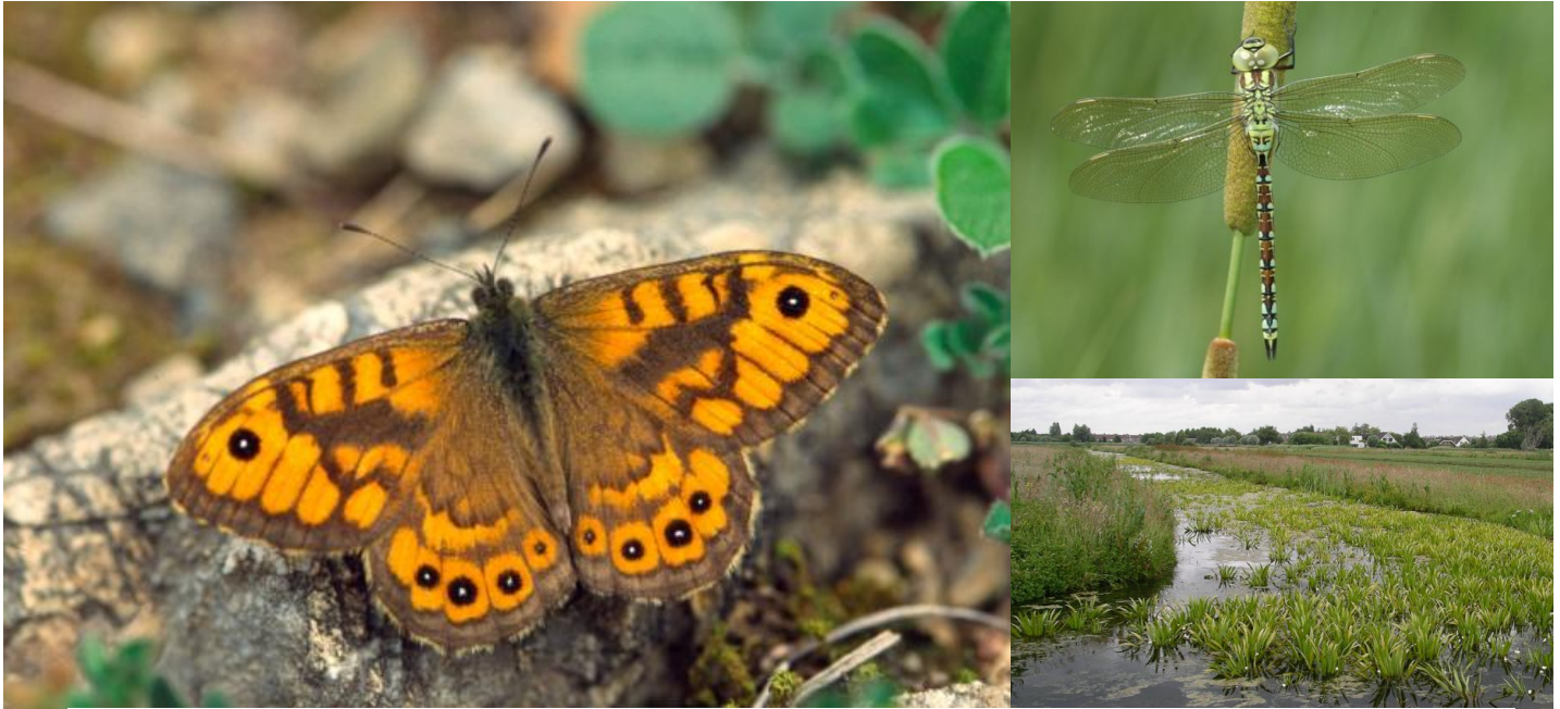
Vlinder: argusvlinder - Libel: groene glazenmaker - Plant: krabbenscheer

Met de Argus-telling worden straks drie bijzondere soorten in het Friese agrarische gebied jaarlijks gemonitord: de argusvlinder, de libel groene glazenmaker en de waterplant krabbenscheer. Elke soort vraagt om een eigen werkwijze, de argusvlinder om minimaal vijf tellingen per jaar, de groene glazenmaker om drie tellingen en bij krabbenscheer voldoet één telling. Deelnemers van de Collectieven, hun gezinsleden of andere vrijwilligers die het leuk vinden om soorten te tellen in agrarisch gebied kunnen meedoen door te tellen langs bosjes, singels, kruidenstroken, sloten (zelfde als Boeren-sloot-telling), bermen en boerenerven. Je kunt alle drie soorten tellen of slechts één of twee van de genoemde soorten.